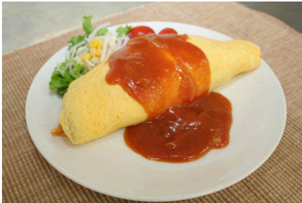
やわらぎオムライス